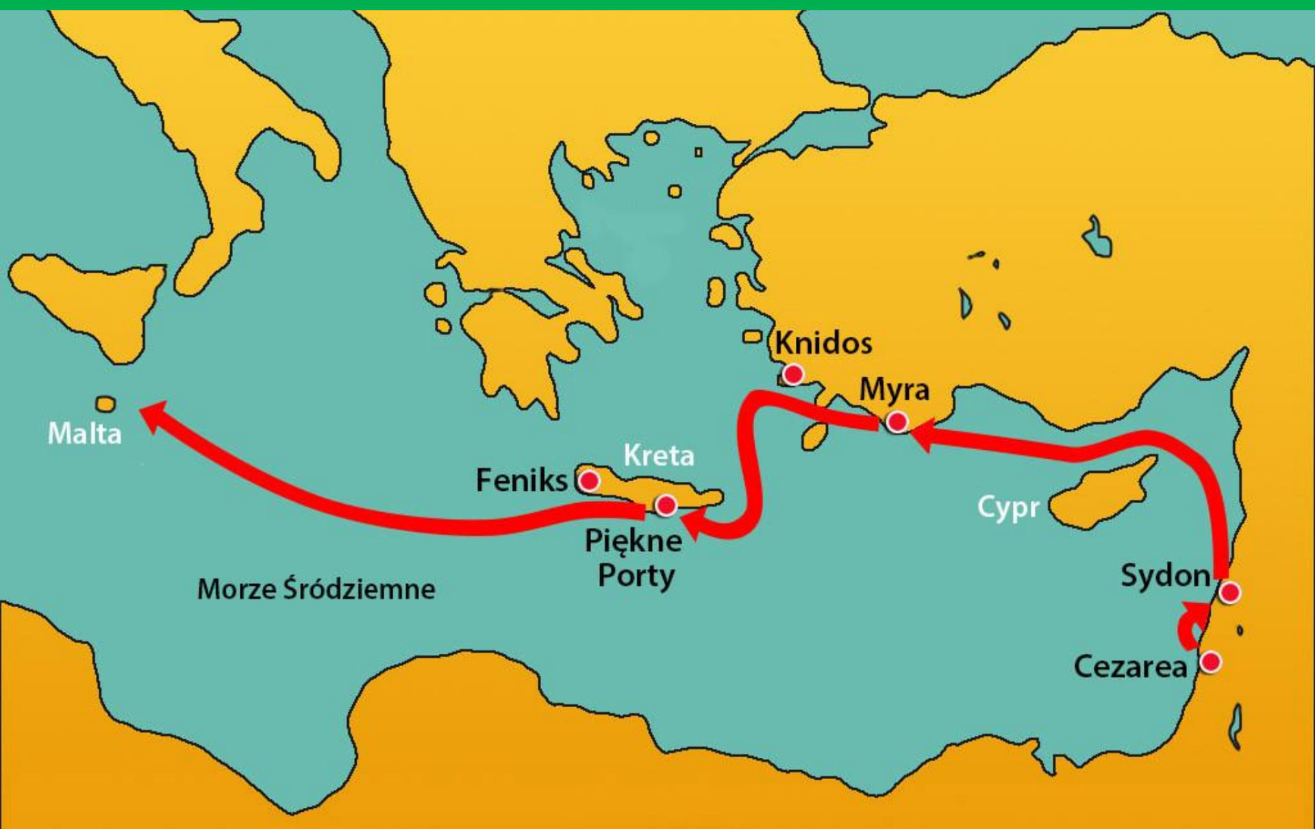
Podróż apostoła Pawła do Rzymu: 58-61 AD

Kiedy nastał dzień, nie mogli rozpoznać lądu (a było to wybrzeże Malty).